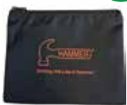
スベアパーツバッグ